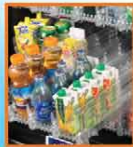
herausnehmbare Produktfächer leichte Reinigung