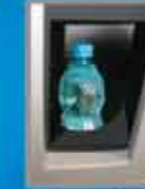
Ausgabe mit Diebstahlschutz